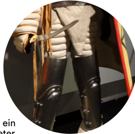
Nachbildung Ausrüstung eines Thraex. Archäologisches Museum der Stadt Kelheim

Der Thraex war eine der ältesten Gladiatorenengattungen. Der Name ist abgeleitet vom Volk der Thraker, beheimatet in Südosteuropa. Der Thraex war mit einem Krummschwert bewaffnet, der sica , die sich insbesondere für kurze und schnelle Hiebe eignete, und trug einen kleinen Schild. Seinen rechten Arm schützte eine besondere Armschiene und zum Schutz seiner Beine hatte er hohe Beinschienen.