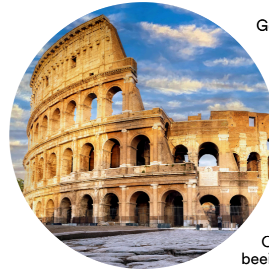
Das Kolosseum in Rom

Gebäude dauerten acht Jahre, von 72 v. Chr. bis 80 n. Chr. Mit einer Länge von 189 Metern, einer Breite von 156 Metern und einer Höhe von etwa 52 Metern umfasste das Kolosseum eine Fläche von 24.000 Quadratmetern und bot im Zuschauerraum ( cavea ) Platz für etwa 50.000 Menschen.