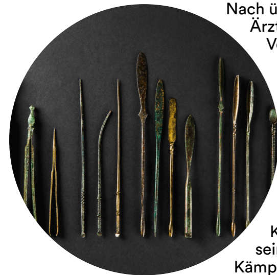
Chirurgisches Besteck.

Da die Gladiatorenausbildung mehrere Jahre dauerte und der lanista viel Geld in die einzelnen Kämpfer investierte, stellten ausgebildete Gladiatoren einen großen Wert dar, den es unbedingt zu erhalten galt. Neben ihren Trainingseinheiten erhielten Gladiatoren daher auch Massagen und Bäder zur Pflege ihres Körpers.