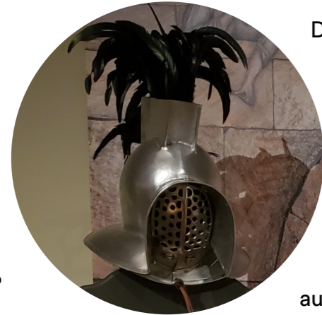
Nachbildung Ausrüstung eines Murmillos. Archäologisches Museum der Stadt Kelheim

Der Murmillo war ein schwerbewaffneter Gladiatoren-Typus und kämpfte meistens gegen den Thraex. Die Bewaffnung des Murmillo bestand aus dem römischen Kurzschwert gladius und einem großen, rechteckigen, gewölbten Schild, dem scutum , das an den Schild der römischen Legionäre erinnert. Als zusätzlichen Schutz am Arm trug er eine manica und eine bis kurz unter das Knie reichende Beinschiene, außerdem einen Helm mit gitterartigem Visier.