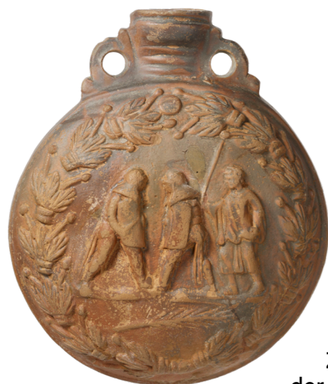
Pilgerflasche mit Darstellung eines Gladiatorenkampfes

Auf der Pilgerflasche ist der Kampf zwischen zwei Provocatoren dargestellt, der von einem Schiedsrichter überwacht wird.