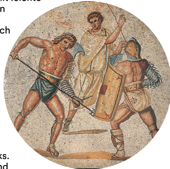
Kampf eines Retiarius gegen einen Secutor, Detail des römischen Mosaikfußbodens der Villa Nennig (@ Tom

Der Retiarius kämpfte stets mit einem Wurfnetz und einem Dreizack. Taktisch versuchte er seinen Gegner auf Distanz zu halten und mit dem Netz zu fangen, bevor er ihn mit seinem Dreizack verwundete. Der Retiarius hatte eine vergleichsweise minimalistische und damit leichte Schutzausrüstung, was ihm im Kampf den Vorteil von Schnelligkeit und Wendigkeit verschaffte. Als Schutz diente ihm lediglich eine besondere Schulterplatte sowie ein Armschutz ( manica ).