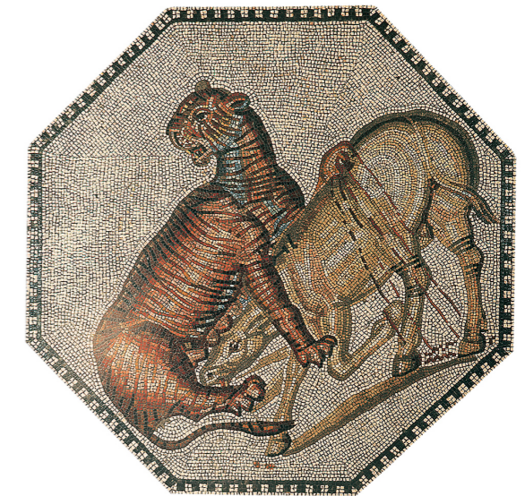
Kampf eines Tigers gegen einen Esel, Detail des römischen Mosaikfußbodens der Villa Nennig

Ende des 1. Jahrhunderts v. Chr. wurden die venationes mit den Gladiatorenspielen im Amphitheater kombiniert. Die Tierhatzen, die oft als eine Art Vorprogramm für die Gladiatorenkämpfe am Nachmittag gesehen wurden, fanden stets am Vormittag statt. Dabei wusste das Publikum bereits im Vorfeld, welche Tiere in die Arena gelassen werden würden, da man die Kämpfe auf Graffiti an Hauswänden oftmals den Bewohnern*innen der Städte ankündigte. Die venationes konnten sehr unterschiedliche Facetten des Spektakels bieten. Es wurden sowohl dressierte Tiere vorgeführt, als auch Tierkämpfe von wilden oder auch harmloseren Tieren inszeniert. Hierbei waren die unterschiedlichsten Konstellationen für einen Kampf denkbar: Löwen kämpften gegen Leoparden, aber auch Bären gegen Nashörner, Elefanten gegen Stiere – sowie Wildtiere gegen zahme Tiere wie Esel. Für Kämpfe zwischen Krokodilen oder Flusspferden gab es sogar Wasserbecken.